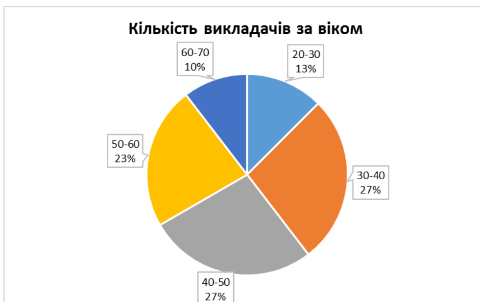
Рис. 2.3. Кількість викладачів за віком

Відповідно до вимог чинного законодавства однією з форм підвищення майстерності викладачів є атестація педагогічних працівників, яка здійснювалась згідно з графіком, розробленим атестаційною комісією та затвердженим директором коледжу. Атестація викладачів на вищу категорію та присвоєння педагогічних звань розглядалася та затверджувалася на засіданні атестаційної комісії Управління освіти і науки Чернігівської облдержадміністрації.