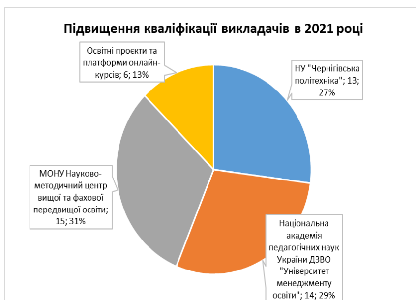
Рис. 2.4. Підвищення кваліфікації викладачів у 2021 р.

У 2021 році 53 викладачі та співробітники, які займаються педагогічною діяльністю, пройшли підвищення кваліфікації у вигляді стажування у Національному університеті «Чернігівська політехніка», курсів підвищення кваліфікації в Університеті менеджменту освіти при Національній академії педагогічних наук України та онлайн курси.