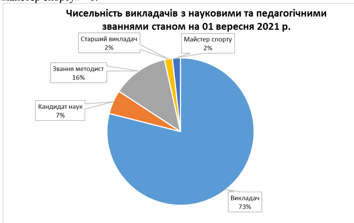
Рис. 2.2. Чисельність викладачів з науковими та педагогічними званнями

Науковий ступінь або вчене звання мають 3 викладача, педагогічне звання «викладач-методист» мають 7 викладачів; «старший викладач» – 1; «майстер спорту» - 1.