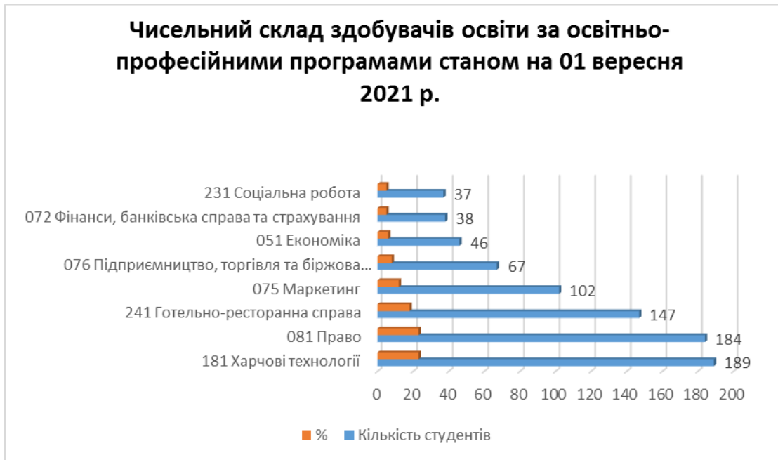
Рис. 1.1 Чисельний склад здобувачів освіти за освітньо – професійними програмами